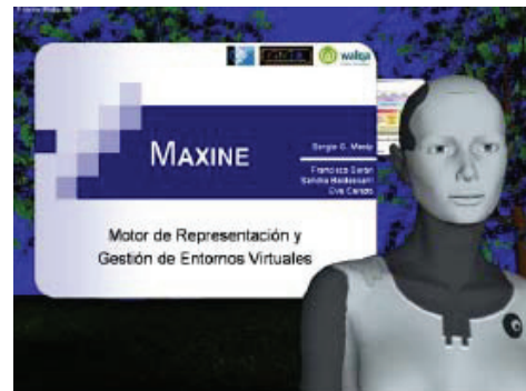
Figura 1. Entorno y agente virtual 3D gestionado por Maxine