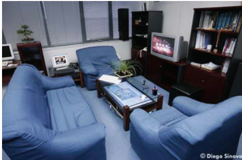
Figura 2. Imagen del entorno inteligente desarrollado

Por encima de la capa de middleware se han desarrollado un conjunto de aplicaciones que utilizan la información de contexto almacenada en la pizarra para realizar acciones dentro del entorno.