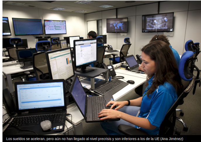
Los sueldos se aceleran, pero aún no han llegado al nivel precrisis y son inferiores a los de la UE (Ana Jiménez)

ROSA SALVADOR, BARCELONA 08/01/2017 02:00 Actualizado a 09/01/2017 15:54