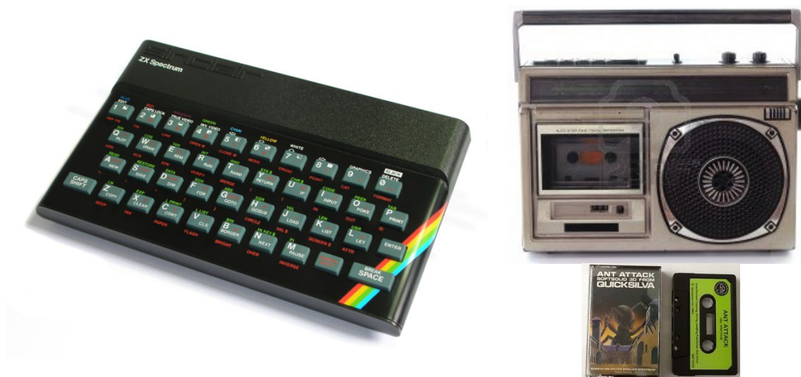
Figura 1: Sinclair ZX Spectrum, reproductor de cassettes, y cinta de cassette conteniendo un videojuego

El ordenador Sinclair ZX Spectrum (1982), como la gran mayoría de los home computers de la época, grababa y cargaba programas utilizando reproductores y cintas de cassette que todo el mundo tenía en casa para escuchar/grabar música (ver Figura 1). A pesar de tener una vida útil oficial de unos 5 años, aún hoy es posible recuperar la información magnética de muchas cintas de la época que no han sido demasiado dañadas a pesar de haber transcurrido unos 30-40 años desde que se grabaron 1 .