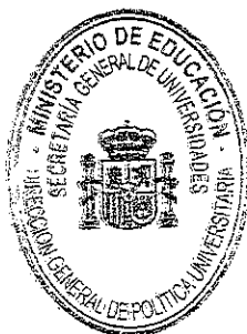
Felipe Pétriz Calvo

EL DIRECTOR GENERAL DE POLÍTICA UNIVERSITARIA